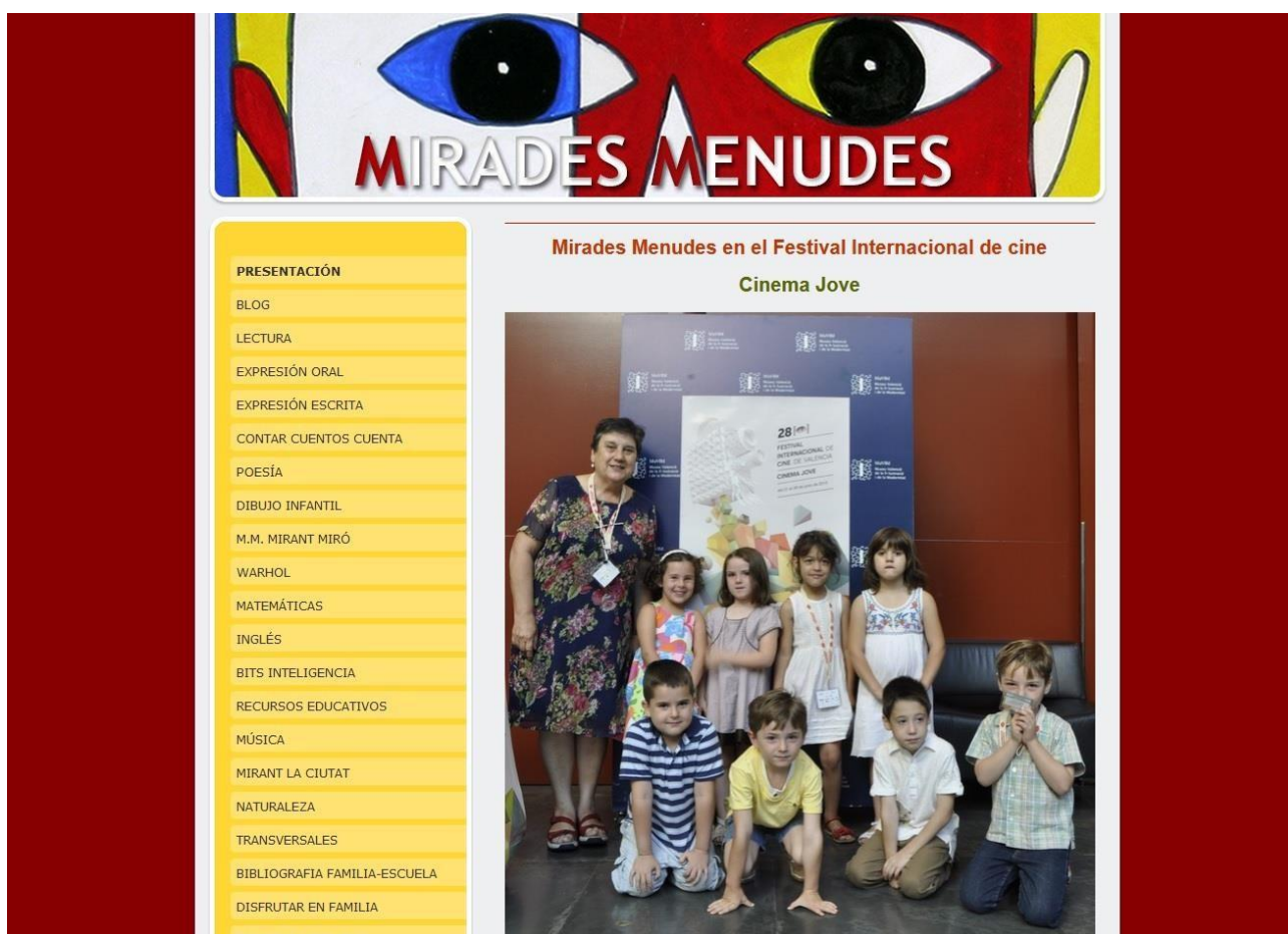
Imagen 1: Página inicial de Mirades Menudes

Como dice Mar de Fontcuberta (1992), ...”no está más informado el individuo que lee cinco periódicos, observa varias cadenas de televisión y oye diferentes emisoras de radio, sino aquel que es capaz de determinar: los elementos básicos para interpretar la información; darse cuenta de las omisiones clave; descubrir las tácticas y estrategias de persuasión empleadas en la emisión de los mensajes, lo cual implica conocer los mecanismos de producción de, la información; y ser capaz, en consecuencia, de aceptar o rechazar el mensaje, global o parcialmente, pero siempre de la manera crítica...”